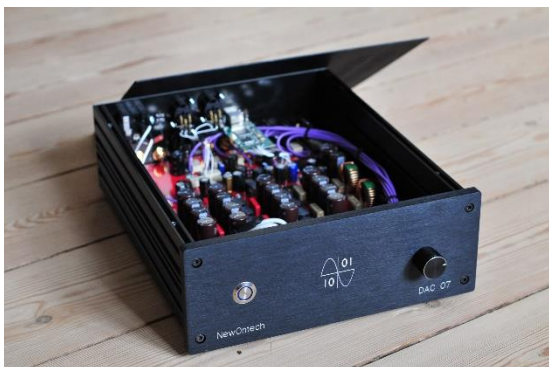
Et kig ned under låget