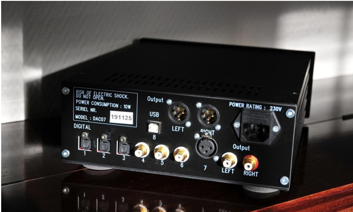
Hele 8 indgange samt både coaxial og balancerede udgange.

Lidt om det tekniske. DAC 07 er en alt-i-en-boks løsning. Meget let at sætte op og enkel og intuitiv at bruge. Der er ind og udgange til nærmest alle typer stik og til testbrug endda rige muligheder for at skifte mellem forskellige kilder via inputvælgeren - "On the Fly". En produktionsmæssig dyr løsning? Ja, men hvem har ikke prøvet at mangle en stiktype, fordi der kommer et nyt apparat til i samlingen? Og man kan jo ikke hver gang have en Ole Nielsen til at udlåne et nyt apparat. Så med DAC 07's muligheder for tilkobling er der fremtidsikret.