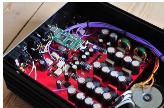
Alt – og rigtig meget i én boks